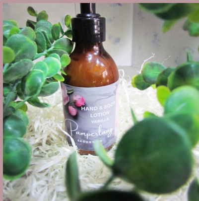
Lyf room/Body lotion 200ml R115

Ons stort gel is beskikbaar in 8 heerlike geure. Verryk met jojoba olie om jou vel te streel en sysag te laat. Geskik vir sensitiewe velle.