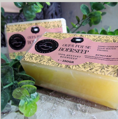
Beesvet Boerseep +-150g R50

Oupa Pot se beesvet boerseep. BEESVET BOERSEEP-Oplissing vir wasdag. Was alle vlekke uit van ghries, olie, gras, bloed en wyn. Was potte, panne, vloere, storte en vensters. Kan gebruik word om te bad, stort en hare was. Geen alergieë aangemeld.