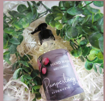
Handewas seep/Hand wash 200ml R115

Verryk met jojoba olie vir n sysagte vel. Beskikbaar in 8 geure en geskik vir die hele gesin, asook ons vriende met sensitiewe velle.