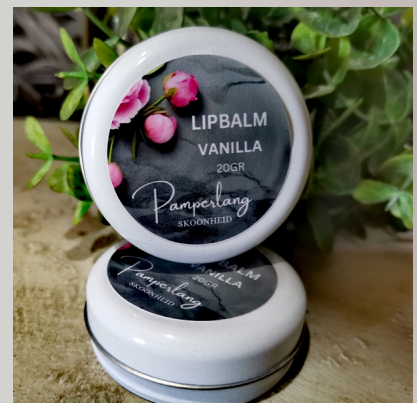
Lip balm 20ml R50

Ons voetroom is ontwerp om baie effektief die vel te bevogtig en te voed sodat dit vinnig verligting sal bring aan gebarste hakke en voete. Dit is ook anti inflammatories. Veilig tydens swangerskap