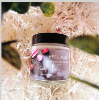
Voetroom/Heel balm 50g R60

Oupa Pot se beesvet boerseep. BEESVET BOERSEEP-Oplissing vir wasdag. Was alle vlekke uit van ghries, olie, gras, bloed en wyn. Was potte, panne, vloere, storte en vensters. Kan gebruik word om te bad, stort en hare was. Geen alergieë aangemeld.