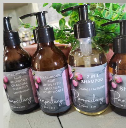
Houtskool shampooe en opknapper/Charcoal shampoo and conditioner s/s free R120 elk

Natuurlike detoks vir jou vel. Verwyder vlekke en is ook strelend vir ekseem en geirriteerde vel. Bevogtig jou vel op n natuurlike wyse. Handgemaak en Vegan!