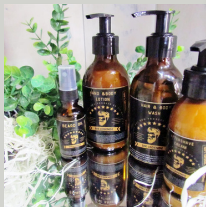
Die Legende Lyfroom/Body lotion 200ml R115

Bederf die legende in jou huis met n lekker lyfwas wat ook as n shampoo gebruik kan word. Heerlike Aqua geur. Verryk met jojoba olie en geskik vir sensitiewe velle.