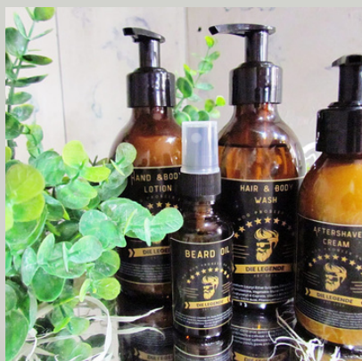
Die Legende Haar & Lyfwas/Hair & Body wash 200ml R115

Bederf die Legende in jou lewe met ons luukse mans reeks!