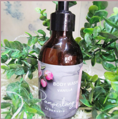
Stort gel/Body wash 200ml R115

Slegs natuurlike olies word in ons produkte gebruik.